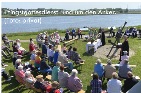
Pfingstgottesdienst rund um den Anker.

Wir saßen beim Pfingstgottesdienst dieses Jahr um den Anker herum.