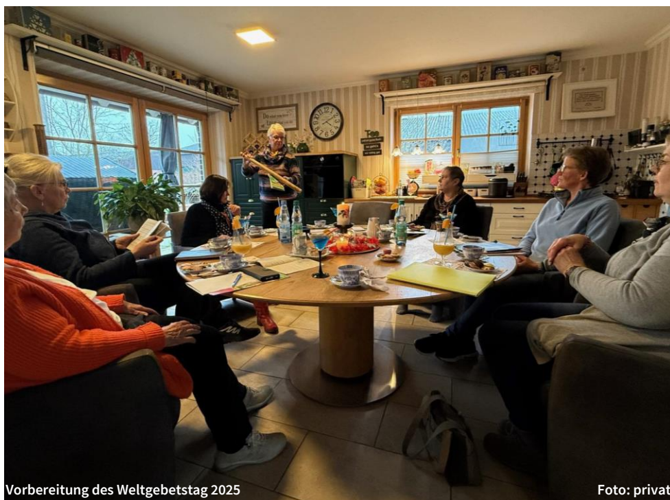
Vorbereitung des Weltgebetstag 2025