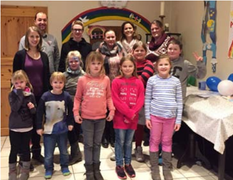
Die Kinderkirche Altenesch mit ihren alten und neuen Mitarbeitern.