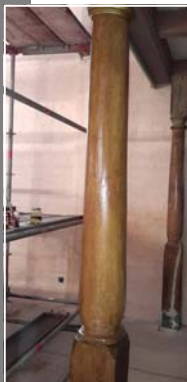
Eine der aufgearbeiteten Säulen.