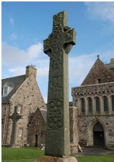
Foto: Die Kirche und das keltische Kreuz von Iona

Gleichzeitig bekommen unsere Abendgottesdienste eine veränderte Form. Fortan werden sie immer um 18 Uhr nach einer Vorlage eines Abendgebetes der Iona-Kommunität aus Schottland gefeiert. Diese Form ist meditativ und mit Lesungen im Wechsel zwischen der Gemeinde und dem/der Liturg/in gestaltet. Sie bietet eine gute Gelegenheit, sich in Ruhe auf die neu beginnende Woche einzustimmen.