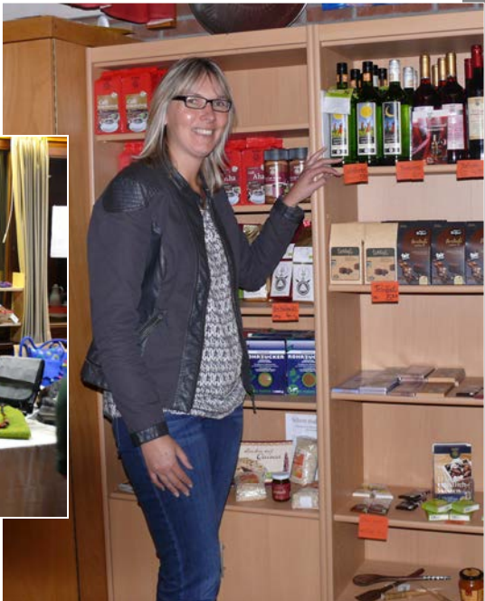
Fotos: Auch Bürgermeisterin Frau Neuke besuchte unseren Laden und war erfreut über das reichhaltige Angebot.