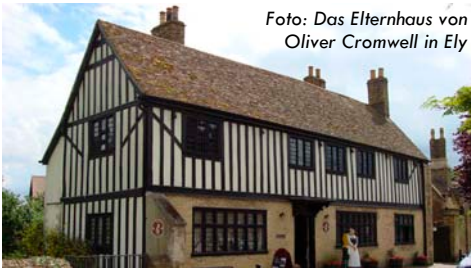
Foto: Das Elternhaus von Oliver Cromwell in Ely

Für die Gemeindefreizeit nach Ostengland gibt es noch ein paar freie Plätze!