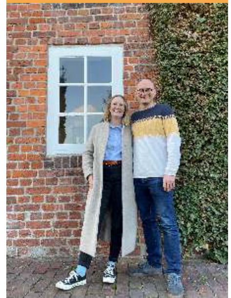
Titelbild von Dominik Weber

"Was haben die Jünger nach der Brotvermehrung mit den 12 Körben voll Brotresten gemacht?", fragt die Lehrerin die Kinder. Chantal meldet sich: "Ich glaube, Semmelbrösel!"