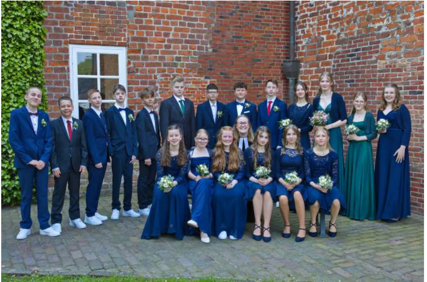
V.r.n.l. und v.h.n.v: