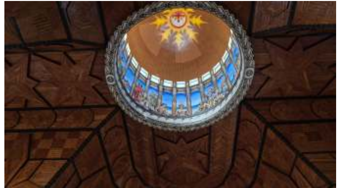
Blick aus der Kathedrale in die Lichtkuppel

Der Stadtkern von Apia unterscheidet sich kaum von anderen größeren Städten im Südpazifik. Eingerahmt von der grandiosen Landschaft großer, dicht grün bewaldeter Berge und tropisch blauem Wasser an teils weiten Stränden und Riffen, ist die Stadt selbst eher trist. Zwar ist das graue 70er Jahre Regierungsgebäude von einem schönen, grünen Park direkt am Wasser umgeben, doch passt es sich gut in die verstaubten Straßen und Häuser ein. Den Straßen sieht man teils den vergangenen Regenschauer deutlich an: ein wenig dampft der Asphalt noch, auf den Straßen liegt teils ein dünner Hauch getrockneten Schlammes . Über die Schlaglöcher hinweg tuckern und dröhnen unaufhörlich Autos und LKW unterschiedlichen Alters und Wartungszustandes.