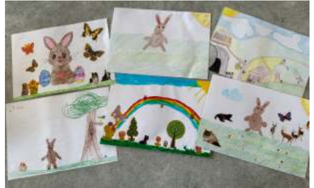
Autor: Kevin Blohm

Für uns war dieses Projekt eine schöne Möglichkeit, Gemeinschaft zu erleben, kreativ zu sein und die Bedeutung von Ostern auf kindgerechte Weise aufzugreifen.